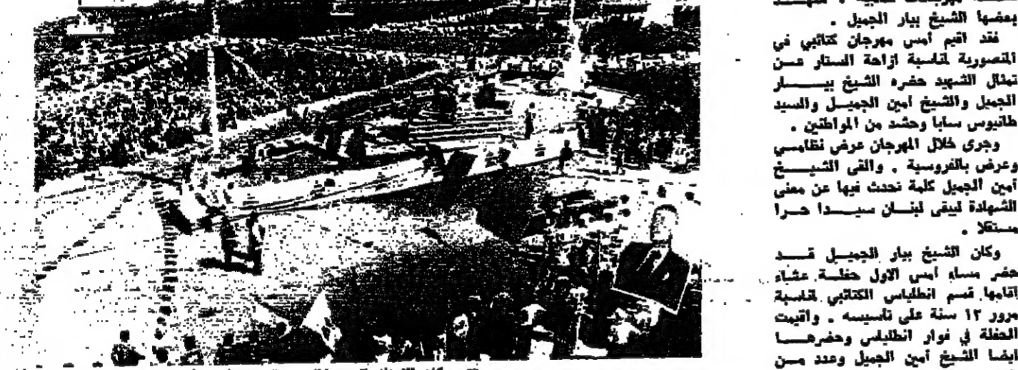
مكان الاحتفال في التصويرية